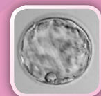
B bez embryoblastu